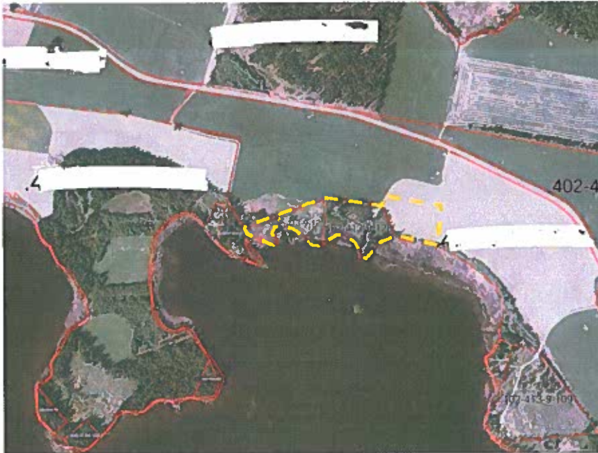
Kuva 2: Ortokuva suunnittelualueesta, kiinteistörajat punaisella ja suunnittelualueen likimääräinen rajausta keltaisella katkoviivalla.