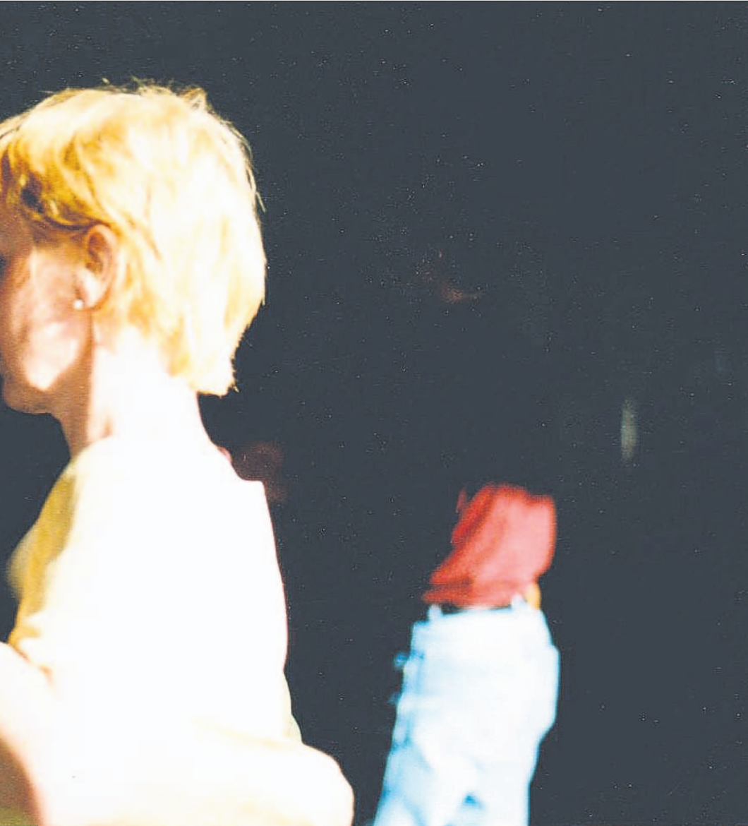
Laitinen tanssin tunnelmissa vuosituhannen vaihteessa.