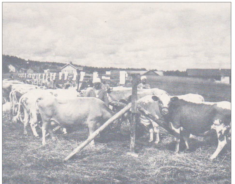
Juhlatalo rakennettiin suojeluskuntataloksi vuonna 1922 ja sen pihapiirissä järjestettiin aikoinaan muun muassa maatalousnäyttelyitä. Kuva on otettu suojeluskuntatalon kentältä vuonna 1935.